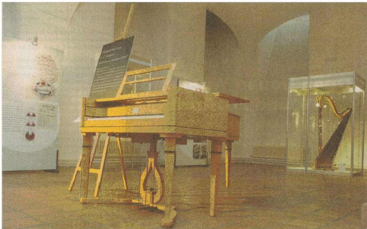
Nachgebaut. Zu sehen ist auch ein Hammerflügel von Louis Dulcken aus der Gründerzeit von Musik Hug.

Wildt'sches Haus, Petersplatz 13, Basel. Montag bis Freitag 14 bis 17 Uhr. Samstag und Sonntag 10 bis 16 Uhr. Vormittags auf Anmeldung: 061 272 33 90. Eintritt frei. Bis 4. Mai.